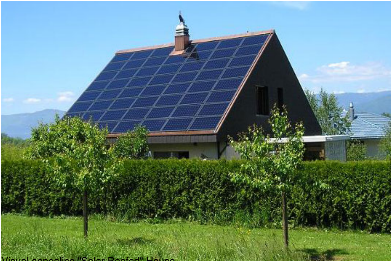
Visual appealing "Solar Roofed" House